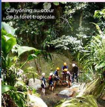
Canyoning au cœur de la forêt tropicale.