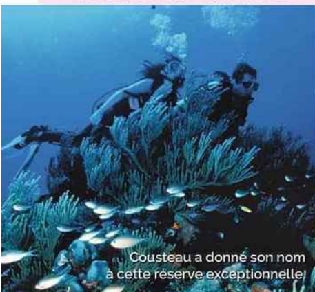
Cousteau a donné son nom à cette réserve exceptionnelle.