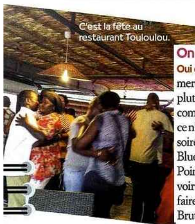
C'est la fête au restaurant Touloulou.