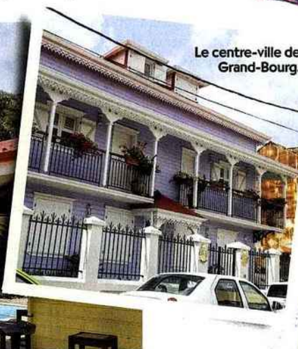
Le centre-ville de Grand-Bourg.